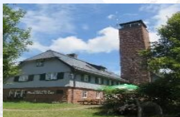
Distance : 15 km