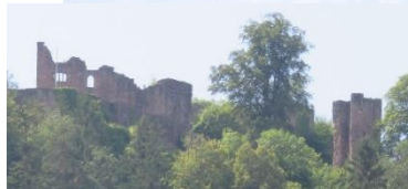
Temps de marche : 5h environ

Après avoir pris d'assaut la ruine du château de Schramberg , nous cheminerons en balcon jusqu' au col du Fohrenbühl en passant par le point culminant du Mooswaldkopf à 884m . Sentiers et chemins nous offriront de belles perspectives sur les vallées environnantes et les habitations typiques de la Forêt Noire . Nous profiterons de l'air pur de la station climatique de Lauterbach .